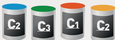
L'assurance de type « C »