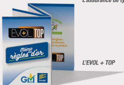
L'EVOL + TOP

Céré-game : six tours de jeu ont déjà eu lieu.