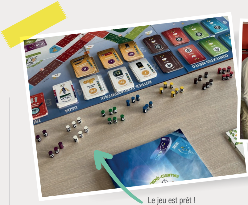
Le jeu est prêt !

L'atmosphère est tendue car chaque groupe veut performer.