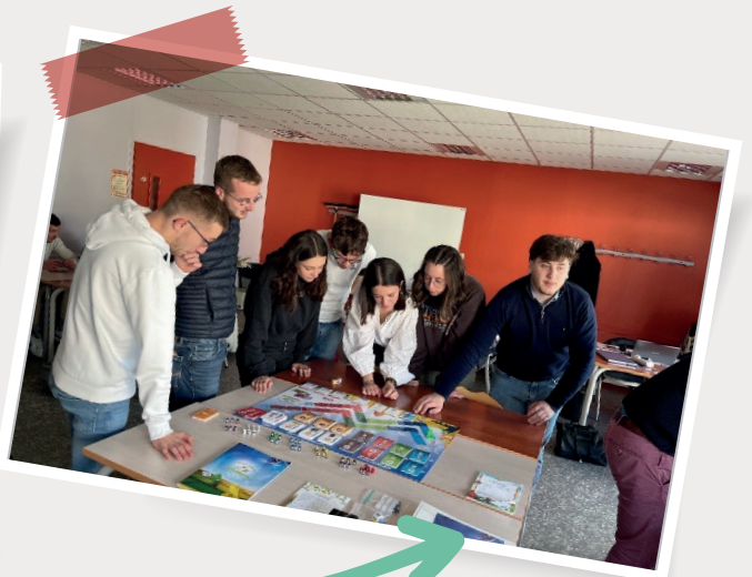
Un coup d'œil sur le plateau pour voir où l'on se situe dans la campagne de vente.

À VOS CÔTÉS... POUR UN ACCOMPAGNEMENT PERSONNALISÉ.