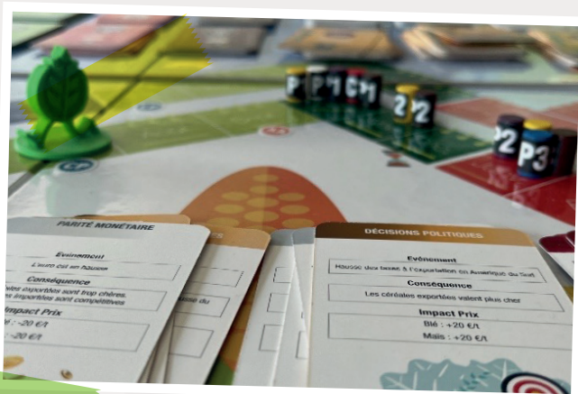
Des assurances de type « P » et « C » ont été achetées.