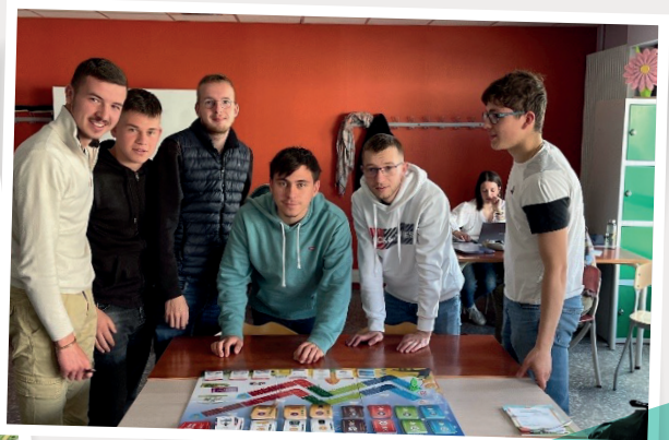
Réflexion en commun