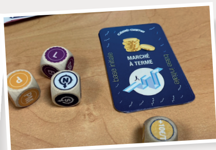
Évolution de la base